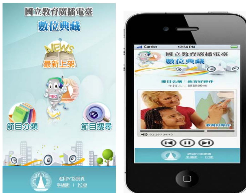
圖 1、典藏資料庫行動版本

本臺為提供跨平台、行動化的網路學習平台，於 101 年規畫建置「典藏資料庫」系統。除依廣播節目屬性將節目分類方便民眾搜尋外，並採用最新的影音串流技術，提供節目隨選收聽；另運用 HTML5 及雲端虛擬化技術滿足影音資源整合及跨平台服務需求，以多元方式，滿足不同使用族群的需求，本系統以精選方式 104 年全年新增 81 個節目，共計 2,664 集。